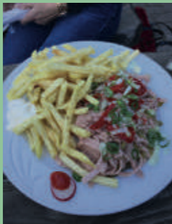
Wurstsalat mit Pommes