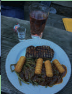
Rindersteak mit Kroketten